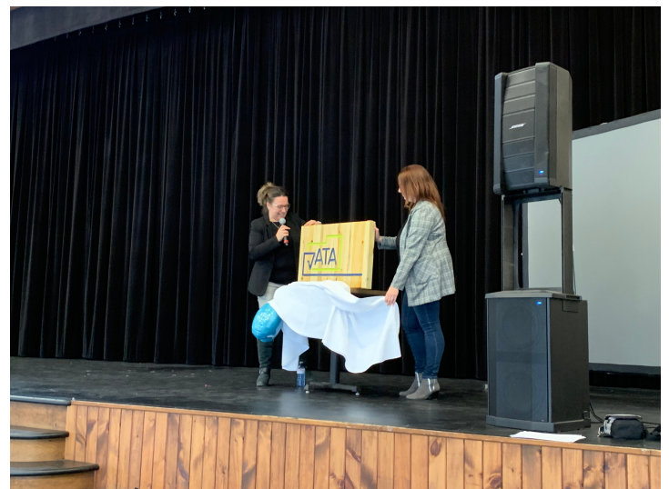
Dévoilement de l'enseigne avec le nouveau logo..